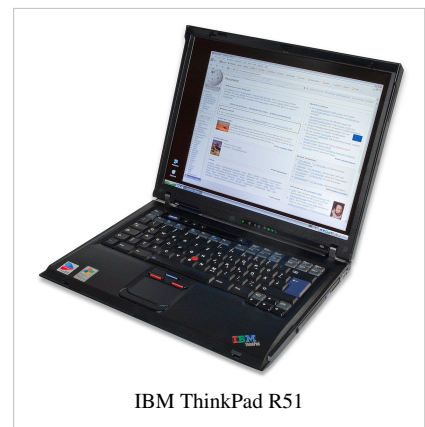
IBM ThinkPad R51

IBM introdujo su exitoso rango ThinkPad en COMDEX 1992 usando la serie de designadores 300,500 y 700 (pretendidamente análogo al rango de coches BMW y usado para indicar el mercado), La serie 300 siendo el "económico", la serie 500 el "rango medio" y la serie 700 el "rango alto". Esta designación continuó hasta finales de los 1990 cuando IBM introdujo a serie "T" como reemplazo de las series 600/700, y los modelos de las series 3, 5 y 7 fueron eliminados y sustituidos por las series A (367) y X (5). La serie A fue más tarde parcialmente reemplazada por la serie R.